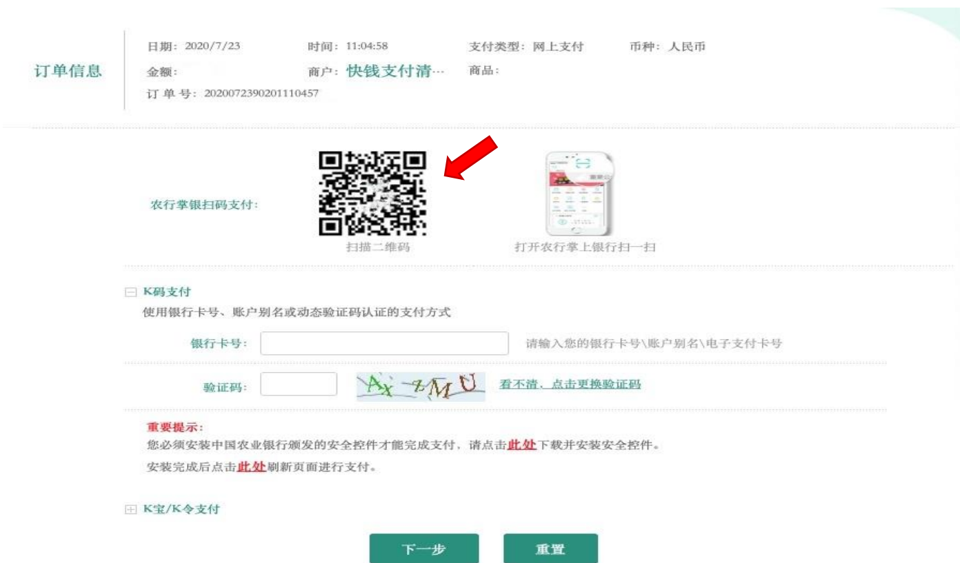
图 5（农业银行支付界面）